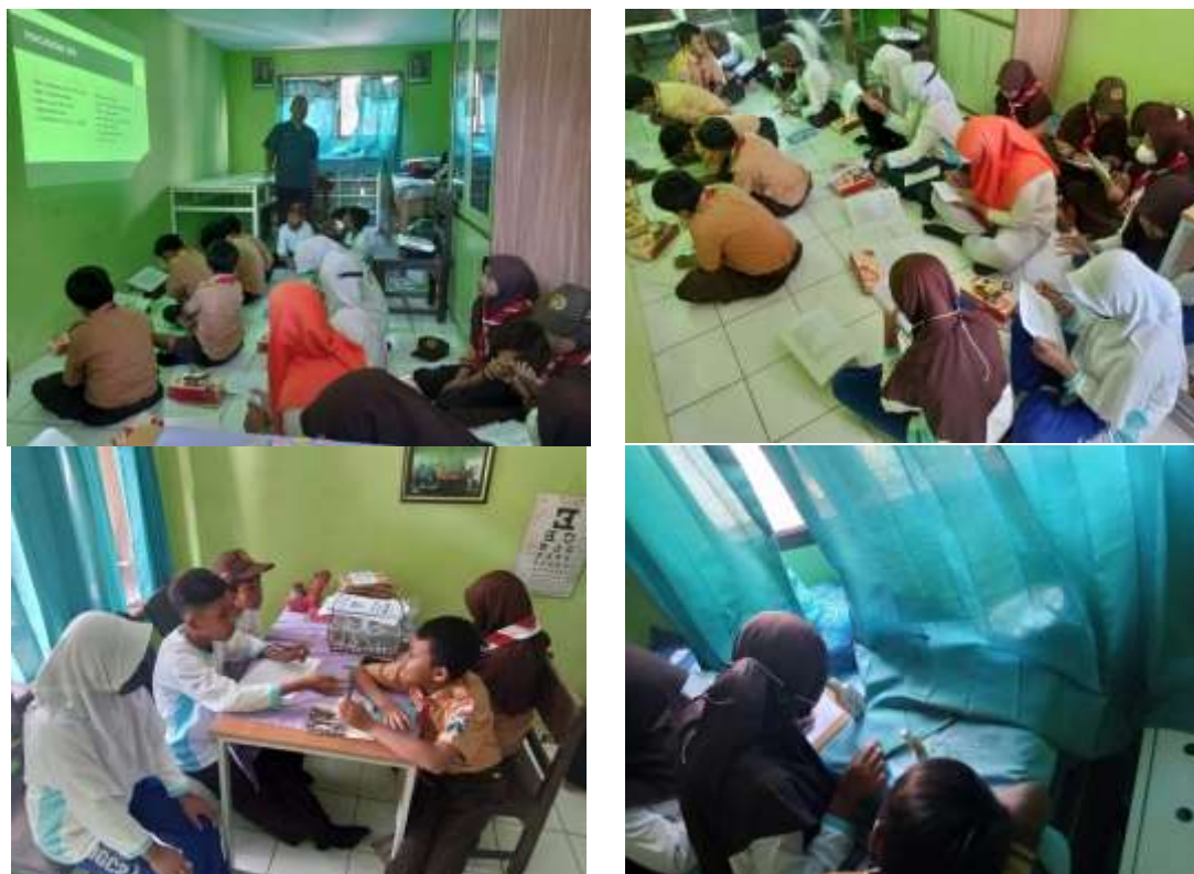
Gambar 2. Dokumentasi Kegiatan Seminar Dan Pendampingan Praktik

selama 40 menit, dilanjutkan dengan acara tanya jawab, setelah itu diakhiri dengan pengerjaan posttest.