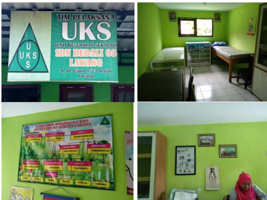
Gambar 1. Sarana dan prasarana UKS di SDN Bedali 05

inventaris alat maupun obat juga belum punya