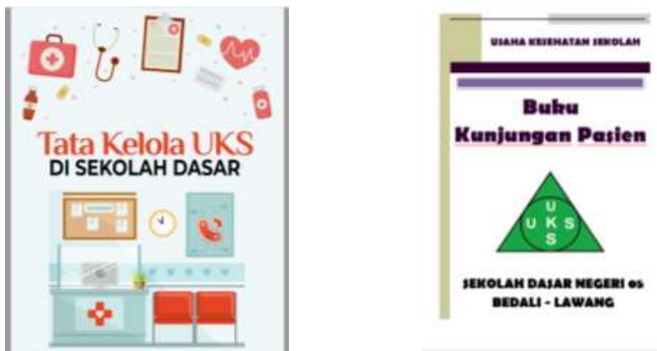
Gambar 4. Sarana Dan Prasarana Pencatatan Administrasi Layanan UKS