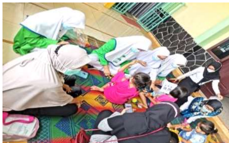
Gambar 2. Kegiatan edukasi