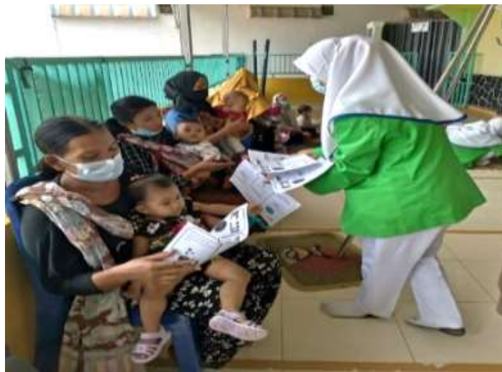
Gambar 1. Kegiatan edukasi

edukasi kontrasepsi Pengetahuan wanita usia subur tentang Kontrasepsi meningkat mencapai (87%).