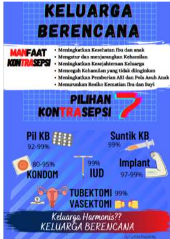
Gambar 3. Poster Kontrasepsi

Edukasi tahap ke dua dilakukan menggunakan media poster. Menurut SR et al., 2014 dalam Aktifah, N dkk 2022 Edukasi dengan metode ceramah terbukti dapat meningkatkan pengetahuan akan tetapi kondisi saat pengetahuan akan melibatkan tahapan kegiatan yang membutuhkan imajinasi agar lebih memahami ketrampilan maka penggunaan metode ceramah kurang maksimal. Pendidikan Kesehatan akan lebih baik menggunakan metode ceramah disertai dengan media pembelajaran lain yang menarik sehingga tidak membosankan. Dalam hal ini maka menggunakan poster yang berwarna dan bergambar menarik dapat meningkatkan ketertarikan untuk lebih memahami isi pesan yang disampaikan termasuk pengetahuan mengenai kontrasepsi.