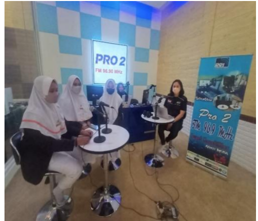
Gambar 1: Kegiatan Penyuluhan Daring di RRI

Pada awal kegiatan dilakukan pre tes untuk mengetahui sejauh mana pemahaman keluarga tentang siaga