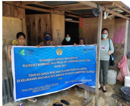
Gambar 1: Kegiatan Penyuluhan Luring door to door